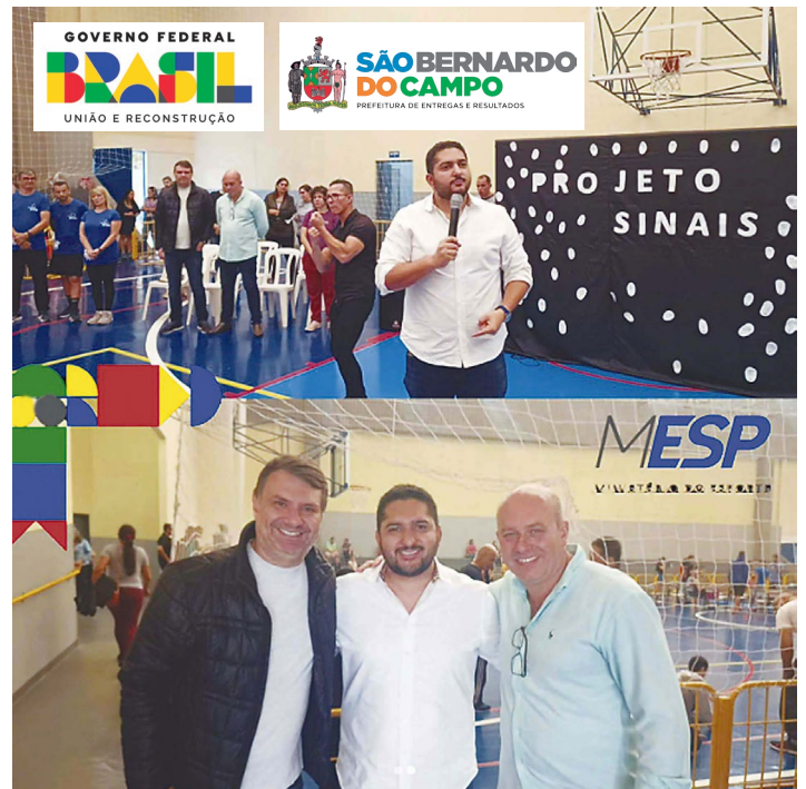
Convênio com o Ministério do Esporte do Governo Federal, para gestão e execução do Projeto Sinais em São Bernardo